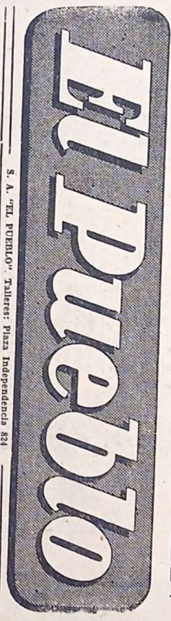
S. A. "EL PUEBLO" Talleres: Plaza Independencia 824