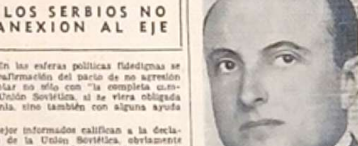
EL Príncipe Pablo de Yugoslavia declaró su lealtad a la Unión Soviética y se comprometió a servir a su patria.

En las esferas políticas turcas bien informadas se expresan esperanzas de que la declaración de la Unión Soviética de su apoyo a la guerra contra Alemania, sino también con alguna ayuda por parte de Rusia.