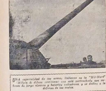
UNA especialidad de las armas italianas es la "M.M.M." (Militia di difesa marittima) que está perfeccionada con el uso de largo alcance y baterías costeras, y se dedica a la defensa de las costas.